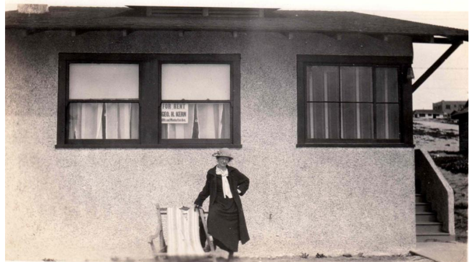
Klara vor dem Haus am Strand in Manhattan Beach Links: Klaus Hartleben auf der Strandpromenade