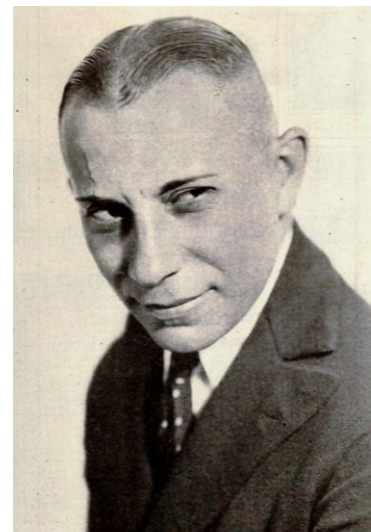
Regisseur Erich von Stroheim 1919