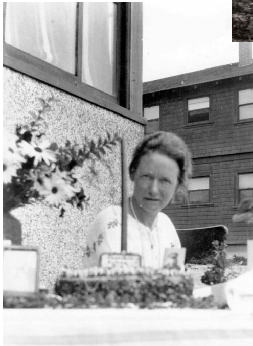
Geburtstagskuchen vor dem Strandhaus